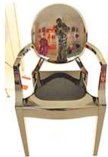
Phillippe Starck.- Modelo original de Kartell sobre el que se han basado los artistas.

Sus patas se visten con tacón o ruedas. Hay quien se atreve a cortar su respaldo o quien estiliza su feminidad en forma de corsé. Los colores se multiplican al resaltar sus posibilidades, pero también los hay que se centran en la transparencia marcando el territorio con agujeros. Flores, corazones y contrastes entre el barroco más auténtico y la postmodernidad.