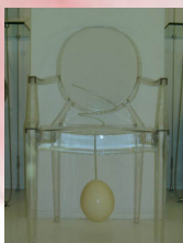
[ Cayuelas ]

Creatividad y tecnología, funcionalidad y glamour, calidad e innovación: esta combinación extraordinaria de cualidades unida a una acertada estrategia de distribución han contribuido a afianzar el éxito de Kartell, una empresa líder en el sector del diseño, que se proyecta hacia un público internacional con una colección cuya originalidad, variedad y amplitud de gama la convierten en única.