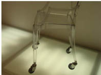
[ Teresa Sapey ]

12 piezas únicas que nacen de la creatividad de un grupo de artistas